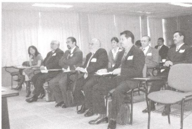
Asistentes a la reunión.